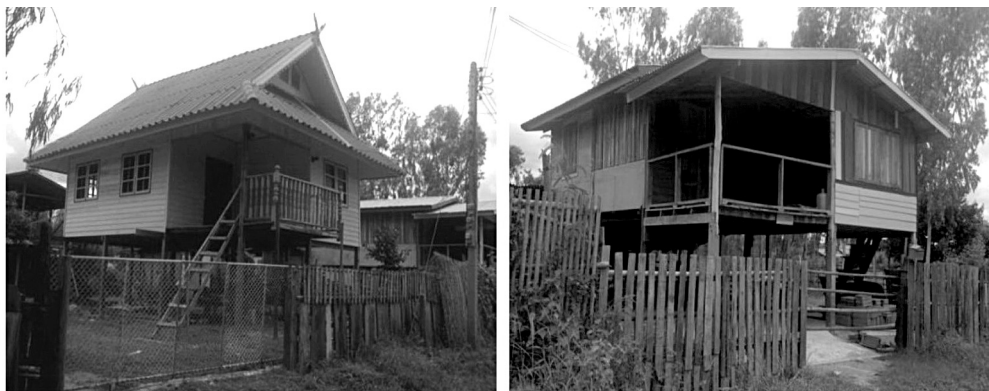
ภาพประกอบ 2 การปรับปรุงแบบบ้านเพื่อการอยู่อาศัยในพื้นที่ชุ่มน้ำ

จากทรัพยากรธรรมชาติและสิ่งแวดล้อมอย่างสมดุลและยั่งยืน ด้วยการใช้แนวคิดการวิเคราะห์ศักยภาพการพัฒนาของพื้นที่ (Potential Surface Analysis : PSA) สำหรับการวิเคราะห์ศักยภาพในการพัฒนาของอนุภาค (Sub-region) อย่างเป็นระบบด้วยข้อมูลเชิงปริมาณ โดยพิจารณาจากดัชนี (Index) หรือตัวแปร (Factor) ต่างๆ ที่เป็นตัวกำหนดศักยภาพของพื้นที่ ซึ่งดัชนีหรือปัจจัยดังกล่าวยังถูกนำไปใช้เปรียบเทียบผลที่คาดว่าจะเกิดขึ้นในพื้นที่ภายใต้สมมุติฐานการพัฒนาแบบต่างๆ เช่น